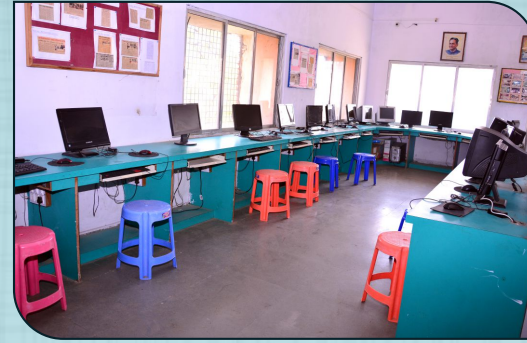
संगणक व भाषा प्रयोगशाला