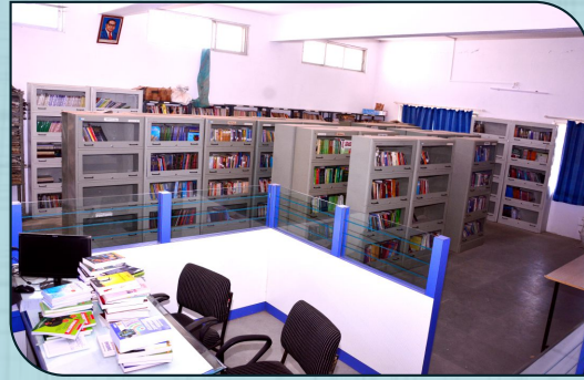
सुसज्ज ग्रंथालय व वाचनकक्ष