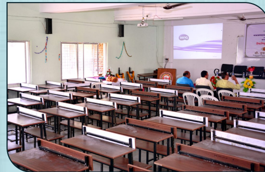
डिजीटल क्लास रूम