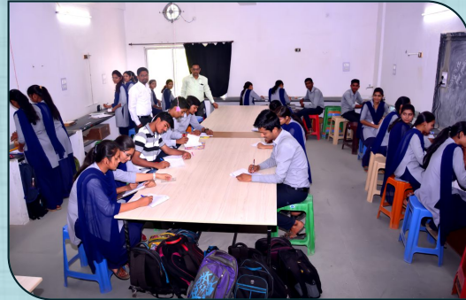
पदार्थ विज्ञान प्रयोगशाला