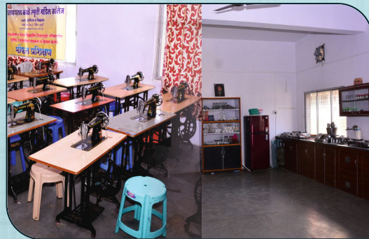
गृहअर्थशास्त्र व फॅशन डिजायनिंग प्रयोगशाला